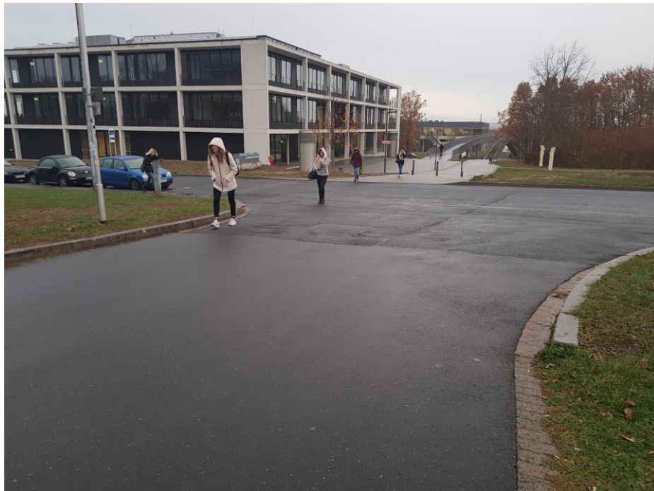
Abb 1.: Die Kreuzung aktuell.